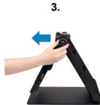
3. Spiegelmodus (bekijk jezelf)