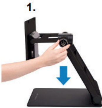
1. Lezen / bureau (lezen, bekijken, handwerk)