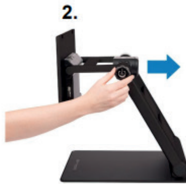
2. Afstandsmodus (lens openklappen)